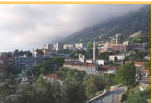
Kruja a várból

1396-ban foglalták el először a törökök, és innen kezdve a törökellenes felkelések fészkévé vált a város. Gjon Kastrioti, Szkander bég apja, 1430-ban állt egy lázadás élére, amit nemsokára leverte a túlerő. A nemzeti hős itt született 1408-ban, és 1443-ban tért vissza szakadár katonáival felszabadítani szülővárosát. A későbbiekben ez a hely lett az albán egység és a törökellenes harcok központja. Emiatt a Porta több hadjáratot is indított a vár ellen eredménytelenül. 1450-ben sikerült szétlőniük a falakat, ennek ellenére nem tudták bevenni várat. 1466-ban majd 1476-ban tapasztalataikból okulva sokkal nagyobb csapatot küldtek a város ellen, de ismét sikertelenül. Végül csak 1478-ban foglalták el Kruját – 10 évvel Szkander bég halála után – akkor is csak a védők kiéheztetésének dicstelen módszerével. A sikeres kényszerfogyókúra után a hős minden nyomát el akarták tüntetni,